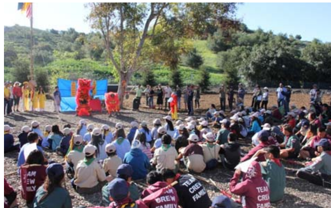
Sói con múa Lân

Mục lì xì cho tất cả đoàn sinh có mặt và phần biểu diễn múa lân của các em Sói con cũng đã kết thúc kỳ trại trong không khí thật vui nhộn.