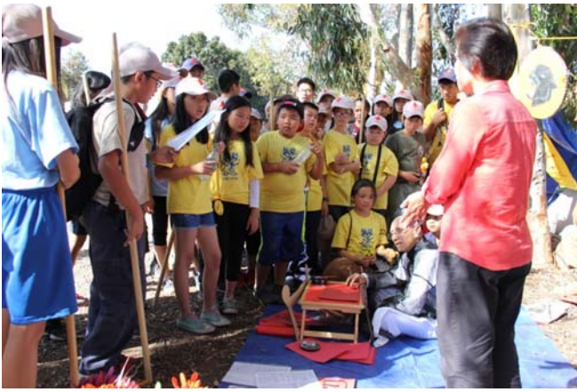
Em trai đọc bài thơ Ông Đồ bằng tiếng Việt