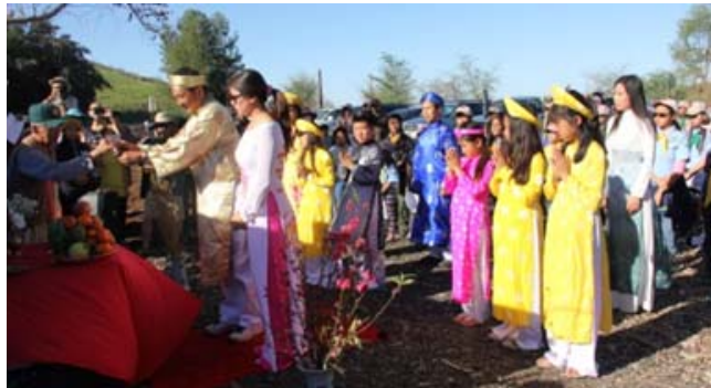
Lễ bái và dâng hương