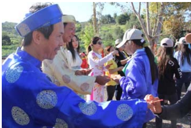
Phụ huynh lì xì cho các em

Mục lì xì cho tất cả đoàn sinh có mặt và phần biểu diễn múa lân của các em Sói con cũng đã kết thúc kỳ trại trong không khí thật vui nhộn.